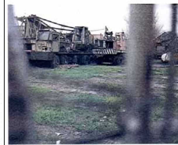
Maquinaria abandonada en el predio y ningún avance de obras