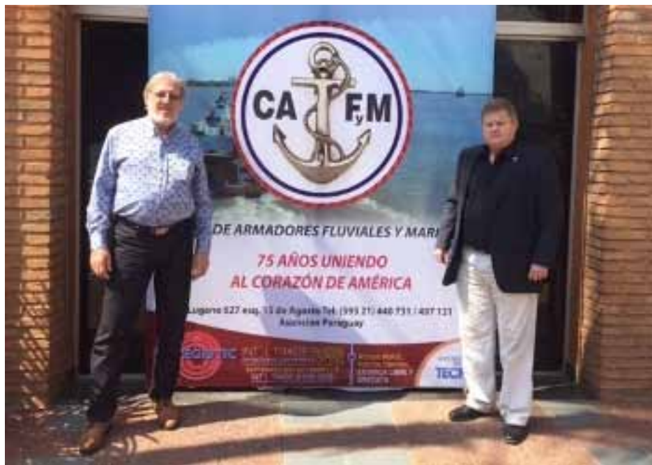
Representantes de la Federación de Marineros del Mercosur e Hidrovías (FeMMH) estuvieron presentes en Navegistic 2015, la feria más importante del sector naviero. Los representantes de los trabajadores argentinos son la clave para el desarrollo en el Paraguay.