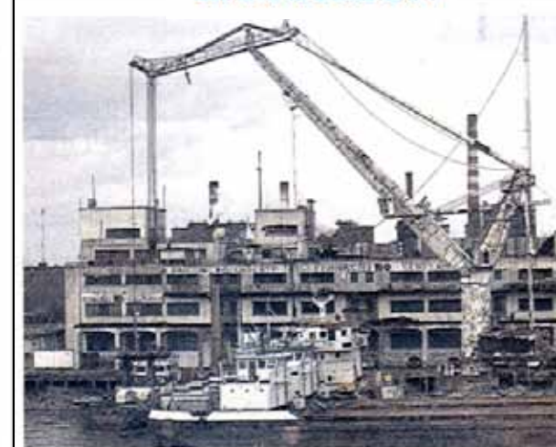
La isla Demarchi, donde se eleva la torre más alta de la región